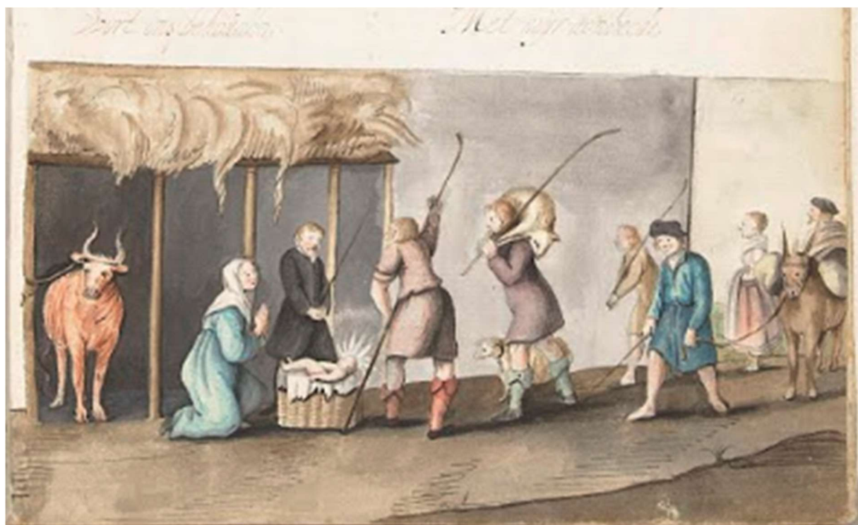
Aquare,.: Aanbidding der Herders, door Gesina (Geeske) ter Borgh, 1631-1690

Vindt het leuk om af en toe wat meer te koken voor iemand anders dan ben je ook welkom bij deze stichting. De werkwijze kun je terugvinden op de website. Hulp bij de warme maaltijd van Stichting Thuisgekookt